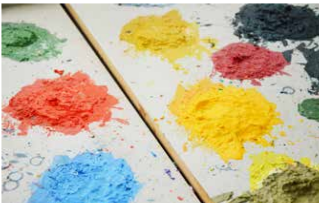
Detalje fra Grazynas pallet