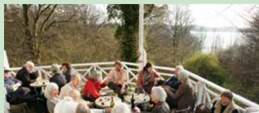
Skovhusets terrasse.

www.skovhus-kunst.dk/om-skovhuset/besog-skovhuset