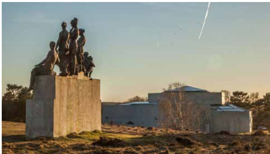
Tegners Museum.