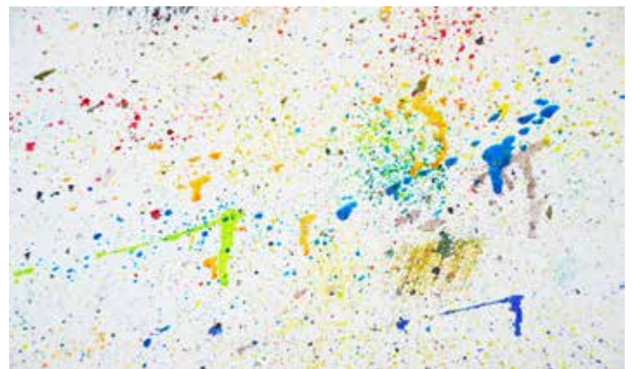
Detalje fra væg i Grazynas atelier