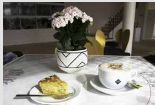
Kaffe og kage for to